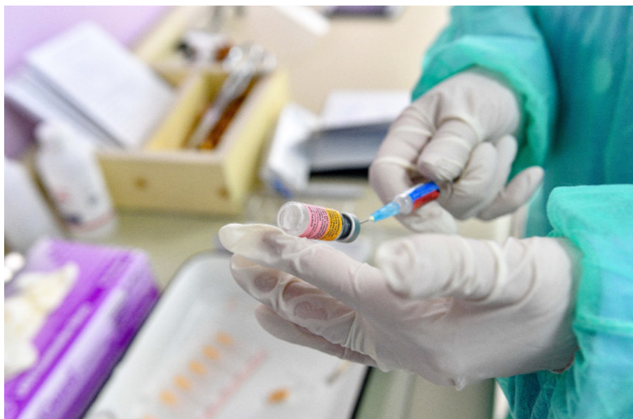
Vaccine preparation.

Është shumë herët të dihet nëse vaksinat COVID-19 do të sigurojnë mbrojtje afatgjatë, andaj do të nevojiten kërkime