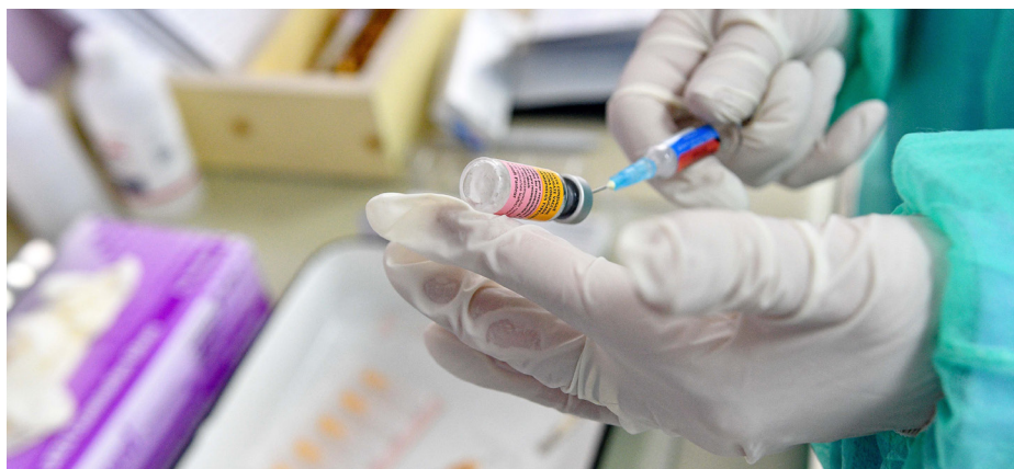
Vaccine preparation.

УНДП, исто така, во месец декември започна серија од четири обуки за развој на услуги во економијата за грижа за лицата кои имаат потреба од тоа и формализирање на секторот за неплатена грижа.