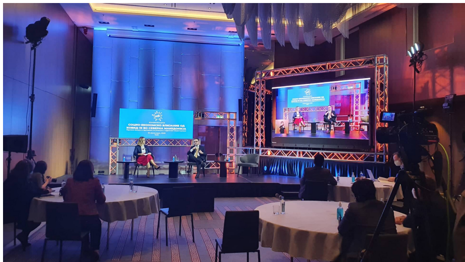
Фотографија од отворањето на хибридна конференција за социо-економското влијание на COVID-19 во земјата, организирано од ОН во Северна Македонија и Finance Think

координиран одговор преку политиките кон „правична транзиција“, со интегрирање на зелени и иновативни извори во развојот по завршување на пандемијата, притоа градејќи отпорност на системите и обезбедувајќи инклузивност со ставање посебен акцент на жените. За да се надминат несразмерно послоните влијанија од кризата врз жените и родовиот диспарат да се преточи во забрзан раст, Владата треба да се обврзе и да ги јакне вештините за родово-одговорно буџетирање, да се инвестира во економијата на давање грижа и да ги зајакне заложбите за подигнување на јавната свест за да се оспорат длабоко вкоренетите предрасуди кон жените.