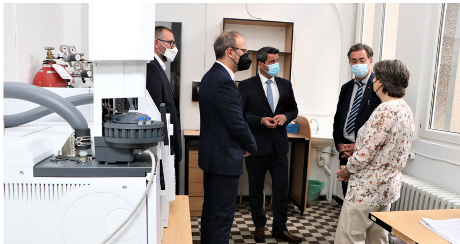
УНОПС набави нова опрема за анализи за животната средина за Лабораторијата за хроматографски анализи.

Канцеларијата на Обединетите нации за проектни услуги (УНОПС) набави и достави нова опрема за спроведување на анализи за животната средина до лабораторијата за хроматографски анализи на Институтот за хемија. Опремата, во вредност од 94.000 американски долари, е донација на Кралството Норвешка преку проектот „Нордиска поддршка за напредок на Северна Македонија“ и ќе се користи за независно следење и контрола на ефектите врз животната средина од процесот на расчистување на линданот во ОХИС. Лабораторијата за хроматографски анализи доби разновидна опрема како гасен хроматограф, семплери, концентратори, лабораториска опрема, растворувачи и стандарди кои ќе овозможат редовен мониторинг на емисиите на загадувачките супстанции во воздухот и почвата во согласност со мониторинг планот за отстранувањето на линданот од ОХИС. Паралелно на тоа, УНОПС исто така ќе ја поддржува лабораторијата во процесот на акредитација со цел методите што ги користи лабораторијата да се усогласени со највисоките стандарди.