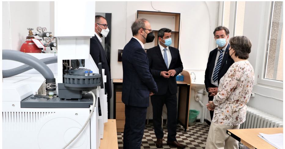
UNOPS ka prokuruar dhe dorëzuar pajisje të reja për kryerjen e analizave mjedisore në Laboratorin për analizën kromatografike

Në kuadër të një trajnimi më shumë se 50 përfaqësues të organizatave të personave me aftësi të kufizuara, qeverisë, agjencive të OKB dhe palëve tjera të rëndësishëm, si dhe personave me aftësi të kufizuara, e forcuan kuptimin e Konventës për të Drejtat e Personave me Aftësi të Kufizuara (KDPA) dhe objektivat e zhvillimit të qëndrueshëm të aftësive të kufizuara (OZhQ). Ky trajnim u zhvillua mes 18 dhe 28 maj, 2021 dhe e ndoqi metodologjinë e zhvilluar globale të UNPRPD-së. Trajnimi ndihmoi në zhvillimin e një kuptimi të përbashkët të pjesëmarrësve në qasjet ndërsektoriale që i mbështesin programet e përbashkëta të UNPRPD-së,