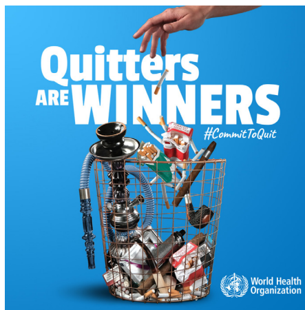
Ditës Botërore pa duhan - OBSH

Për kremtimin e "Ditës Botërore pa duhan" (31 maj çdo vit), Organizata Botërore e Shëndetësisë (OBSH) organizoi një ngjarje në partneritet me Institutin e Shëndetit Publik, gjatë së cilës u prezantuan të dhënat për përdorimin e duhanit në Maqedoninë e Veriut dhe në botë dhe u promovua pakoja e OBSH-së për braktisjen duhanit. Shënimi i ditëve të tjera përmes mediave sociale përfshinte Ditën Botërore të biçikletave (3 qershor), Ditën Botërore të mjedisit (5 qershor), Ditën Botërore të sigurisë ushqimore (7 qershor) dhe Ditën Botërore të dhuruesve të gjakut (14 qershor).