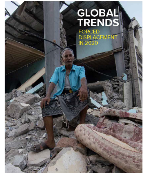
UNHCR raportit të Trendeve Globale të vitit 2020

70 YEARS PROTECTING PEOPLE FORCED TO FLEE