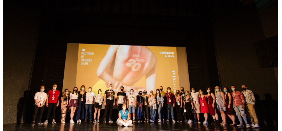
ECO programme on CINEDAYS film festival was organised to promote activities on the importance of protecting our environment

UNICEF-i e mbështet zhvillimin e Strategjisë Nacionale për Drejtësinë për Fëmijët në Republikën e Maqedonisë së Veriut [2022-2026] dhe Planin e Veprimit [2022-2023]. Strategjia është duke u zhvilluar në bashkëpunim të ngushtë me Këshillin Shtetëror për Parandalimin e Delikencës së Fëmijëve, me mbështetjen e ekspertëve ndërkombëtarë, përmes një serie punëtorish dhe konsultimesh, dhe do të miratohet deri në fund të vitit 2021. Aktivitetet janë pjesë e financuar nga BE-ja, me kofinancim nga UNICEF-i në kuadër të projektit "Drejtësia